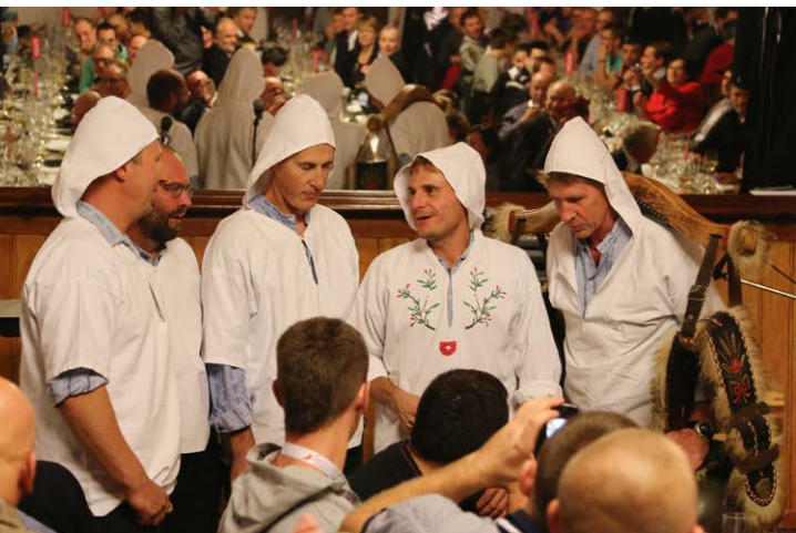
Urchige Feste & lebhaftes Brauchtum