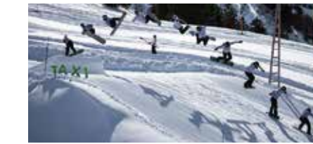
Snowpark Shredisfaction BEIM SKILIFT HOLIBRIG, BIS ZU VIER LINES MIT DIVERSEN RAILS, BOXEN UND KICKERN