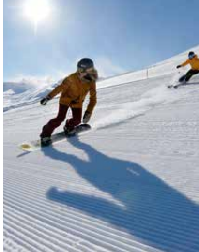
GÜLTIG WÄHREND DER OFFIZIELLEN WINTERSAISONDauer DER BETEILIGTEN SKI GEBIETE