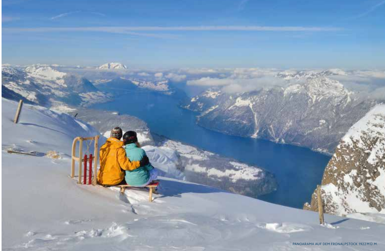
PANOGRAMMA AUF DEM FRONALPSTOCK 1922 M.Ü. M.