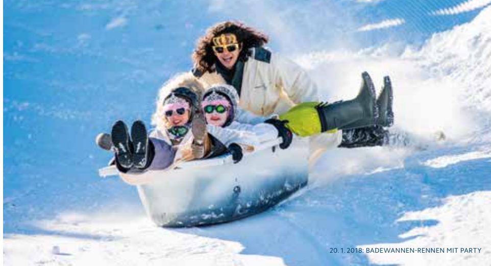
20. 1. 2018. BADEWANNEN-RENNEN MIT PARTY